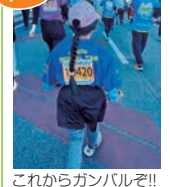
これからガンバルぞ!!