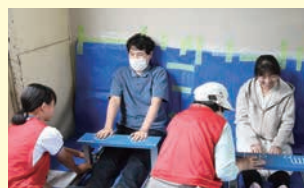
いわたスポレク 健康フェスティバルでの計測係