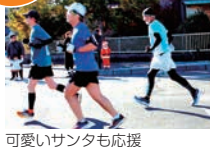
可愛いサンタも応援