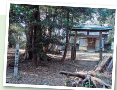
戦国時代に戦いが繰り広げられた社山城跡