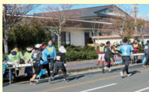
ジュピロマラソンでの給水係