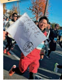
フレー! フレー! ババ