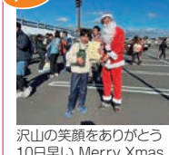
沢山の笑顔とありがとう 10日早い Merry Xmas