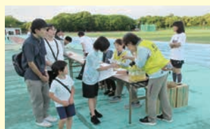
市町對抗駅練習会での受付係