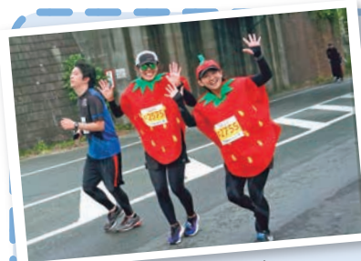
第25回大会ではフォトコンテストで表彰されました

私自身、以前はスポーツにあまり縁がなく、たまに山登り程度しかしない人でしたが、写真が趣味であったことから、10年ほど前からジュビロマラソンの記録写真のお手伝いをする機会をいただいています。