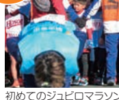
初めてのジュビロマラソン