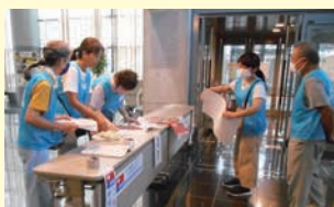
車いすバスケットボール 大会での案内係