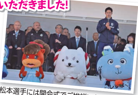
松本選手には開会式でご挨拶いただきました