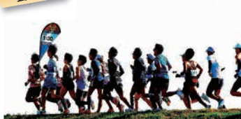
みんなでひとつになった