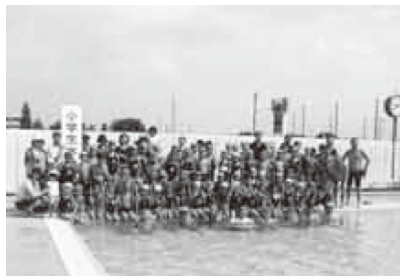
平成20年8月教室 前組

会場は諸事情から、平成11年～13年が南部中学、平成14年～17年が中部小学校、平成18年から市民プールで開催しています。