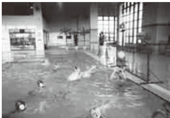
平成15年1月冬季水球教室

参加者は30～40人程度で、教室参加者でチームを編成し、ジュニアオリンピックにも出場したこともあります。