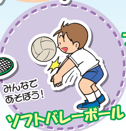
みんなであそぼう! ソフトバレーボール