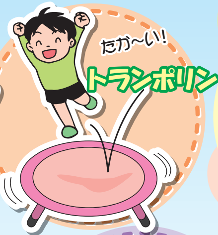
たか~い! トランポリン