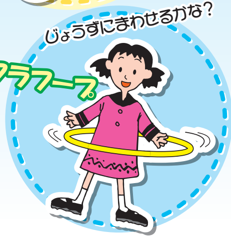
びょうずにまわせるかな? フラーフ